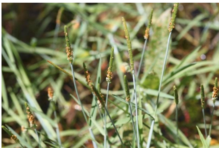
Alopecurus aequalis L.