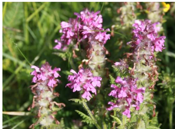
Pedicularis verticillata L.