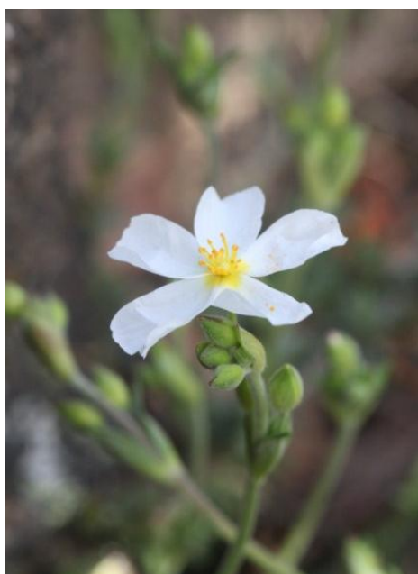
Halimium umbellatum (L.) Spach