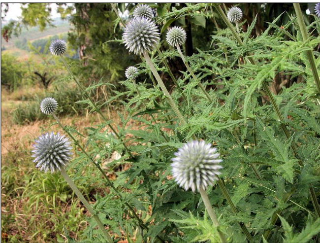
Echinops sphaerocephalus