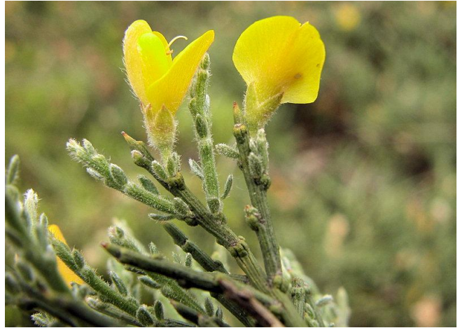
Genista pulchella subsp villarsii