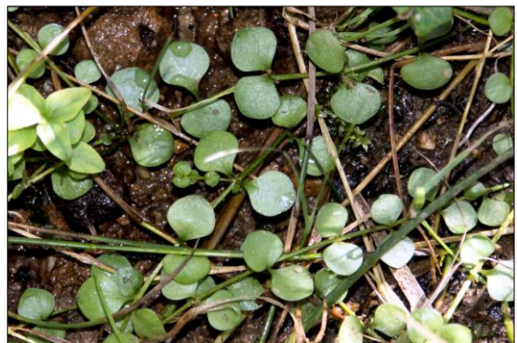
Anagallis tenella