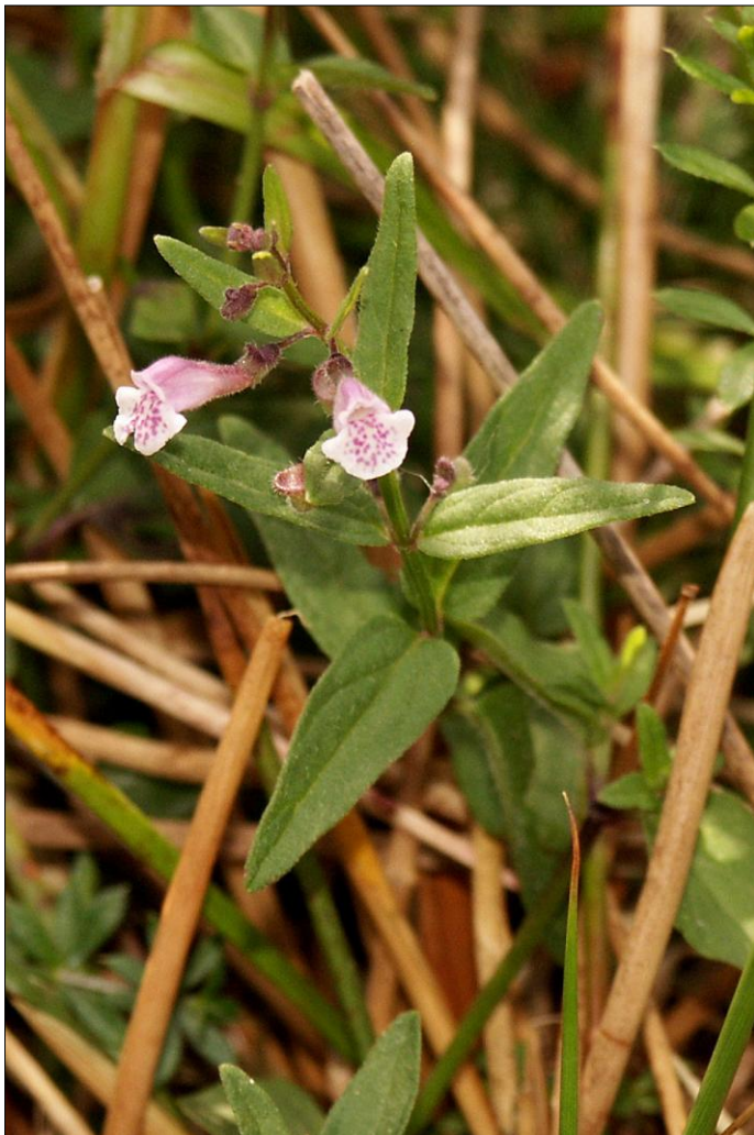
Scutellaria minor