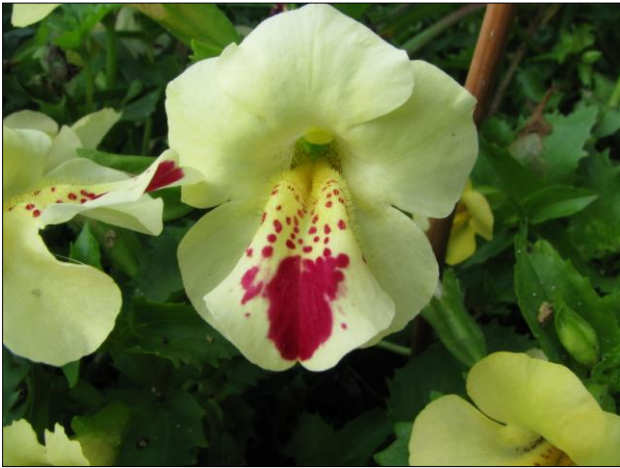
Mimulus sp.