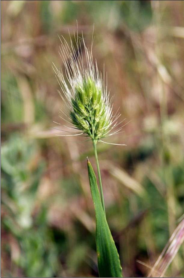
Cynosurus echinatus