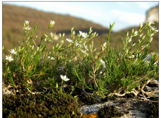
Minuartia rostrata