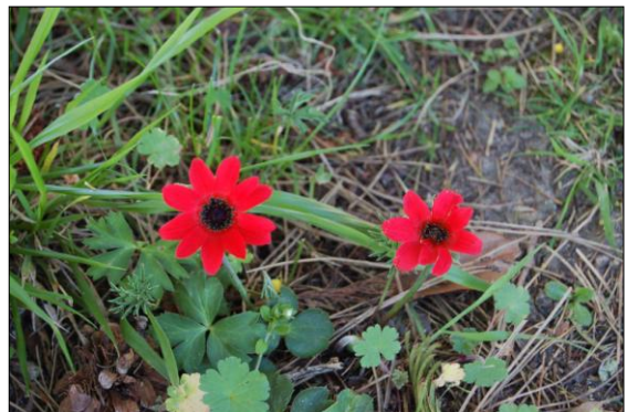
Anemone pavonina